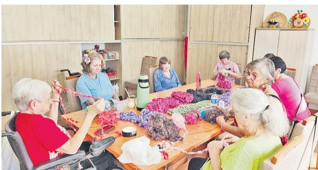
Grupos se reúnem semanalmente no Cras

Para avançar ainda mais em políticas públicas específicas para as pessoas com deficiência a Prefeitura de São José do Hortêncio possibilita ações para inclusão social. Uma delas acontece todas as segundas-feiras no CRAS Novo Horizonte, a partir das 14 horas. O contato é possível através do WhatsApp: (51) 99988-1509.