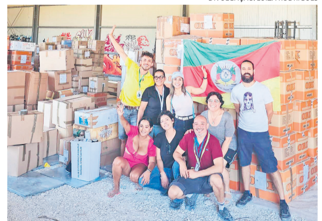
Voluntários que ajudaram na triagem